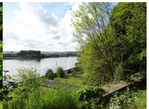
La vallée de la Seine située à proximité