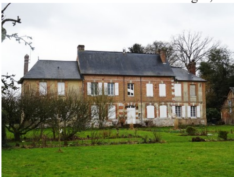
Château à Caumont

Les avis seront cohérents avec ceux émis ces dernières années, à savoir : pas de maisons à volume compliqué (type V, W, Y, ou Z), pentes à 45° pour les volumes principaux, ardoise ou tuile plate de teinte brun vieilli, à 20u/m 2 , avec un débord de toiture de 20cm, enduit de teinte beige clair avec modénatures (au choix : chaînages, encadrement de fenêtres, soubassement, colombage...). *Voir les autres fiches.