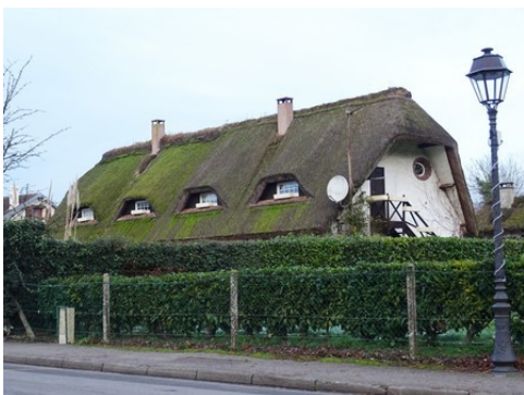
Une toiture en chaume