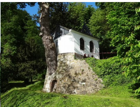
La chapelle de la Ronce