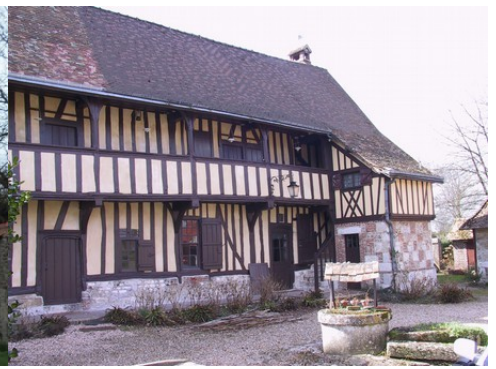
Le logis aligné sur la route (vue proche) Le logis depuis la route (vue éloignée) La façade du logis sur cour