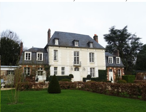
Le manoir du Plouzel du XVII e siècle