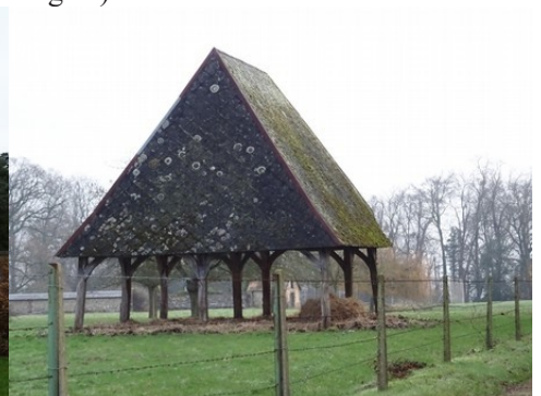
L'architecture rurale aux alentours